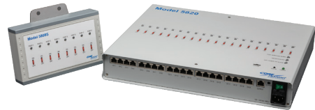
Model 5820 Ionizer Monitoring System